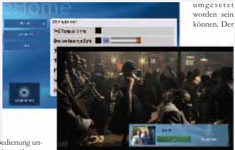
Abbildung 3: Hausbedienoberfläche für Windows MCE. Im Hintergrund: Steuerung des Wohnzimmers. Im Vordergrund: Einblendung der Türkamera während des Fernsehens

Der Mensch wird im Zuge wachsender Mobilität zwischen unterschiedlichen Umgebungen wechseln und deshalb in Zukunft mit unterschiedlichen vernetzten Umgebungen interagieren müssen. Dabei wird jede Umgebung ihre eigene Auswahl an Geräten, Diensten und eigenen Funktionen besitzen, welche durch unterschiedliche Hersteller und Provider umgesetzt werden können. Der