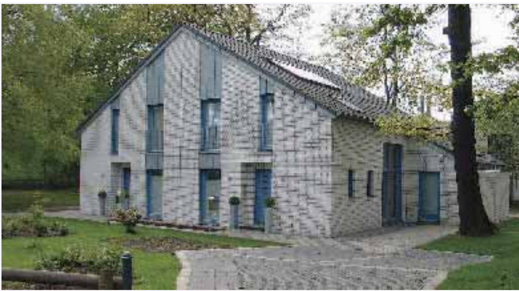
Abbildung 4: inHaus – Entwicklungs- und Forschungslabor des Fraunhofer IMS

artiger Prozess ist in einer Welt, die aus einer Vielzahl unterschiedlich vernetzter Umgebungen bestehen soll, eigentlich nicht vorstellbar. Schnell würde sich der Mensch überfordert fühlen und die neuen Systeme nicht akzeptieren und daher meiden.