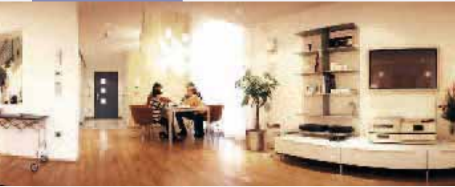
Abbildung 2: Einblick in das Wohnlabor. Zukünftige Wohnumgebungen werden sich von den heutigen kaum unterscheiden - die Technik arbeitet im Hinter- grund